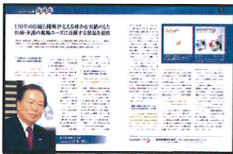
●トップインタビュー