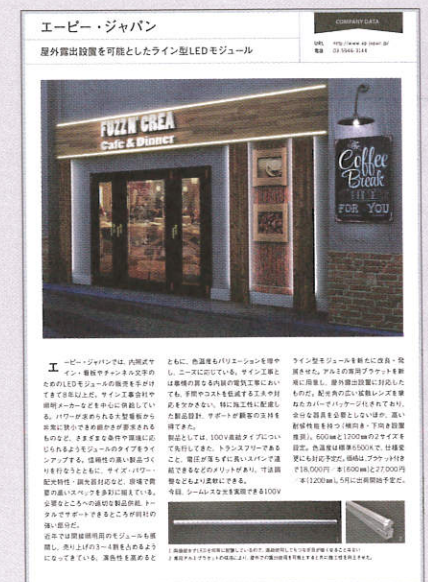
※掲載イメージ(カラー1P)

*写真は、ご提供いただいた製品写真や納入写真を使用します。 *紹介用記事は、弊社にて作成します。