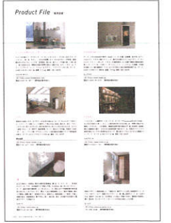
▲月刊商店建築 誌面掲載例

プロダクトファイルでは、号毎に決められたテーマに沿った最新の製品情報を1ページあたり6点のスペースで紹介いたします。掲載内容は、製品写真(1点)、製品紹介文(200字以内)、会社情報、資料請求番号を掲載します。