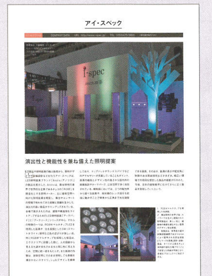
※掲載イメージ(カラー1P)