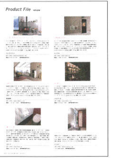
▲月刊商店建築 誌面掲載例

プロダクトファイルでは、号毎に決められたテーマに沿った最新の製品情報を1ページあたり6点のスペースで紹介いたします。掲載内容は、製品写真(1点)、製品紹介文(200字以内)、会社情報、資料請求番号を掲載します。