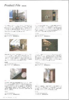
▲月刊商店建築 誌面掲載例

プロダクトファイルでは、号毎に決められたテーマに沿った最新の製品情報を1ページあたり6点のスペースで紹介します。掲載内容は、製品写真(1点)、製品紹介文(200字以内)、会社情報、資料請求番号を掲載します。