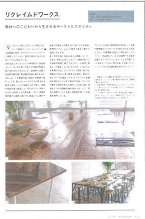
※掲載イメージ(1ページ)

*写真は、ご提供いただいた製品写真や施工例写真を使用します。 *紹介用記事は、弊社にて取材のうえ作成します。