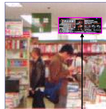
書店天吊りポスター展開事例